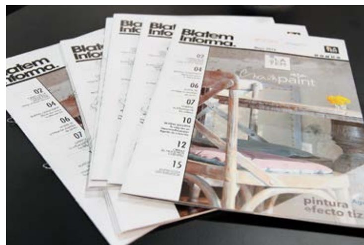
Revista Blatem Informa