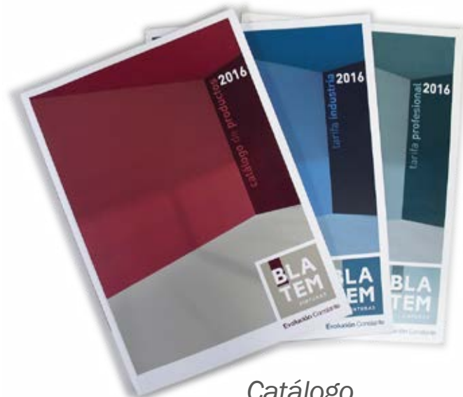
Catálogo de productos