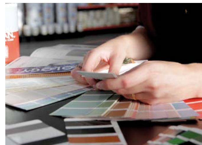
Cartas de color y folletos de productos