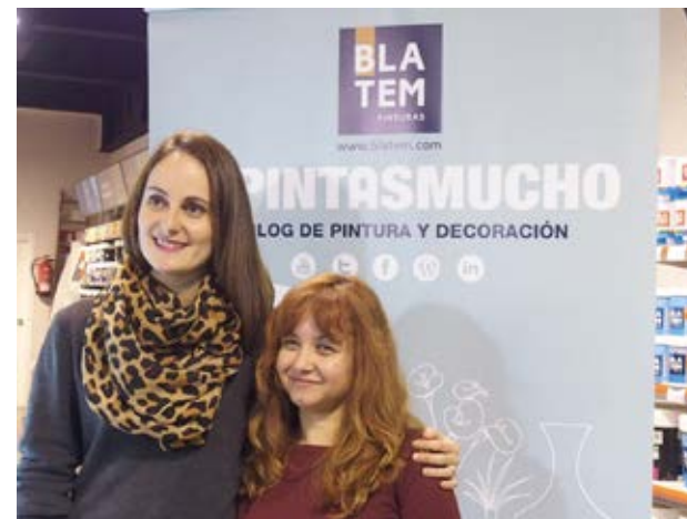
Eventos "Tú Pintas Mucho"