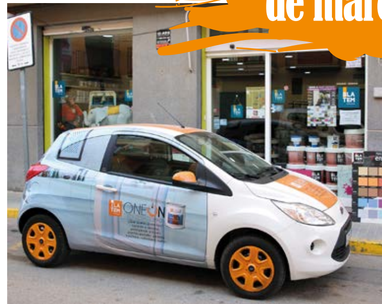
Blatem OneOn Car