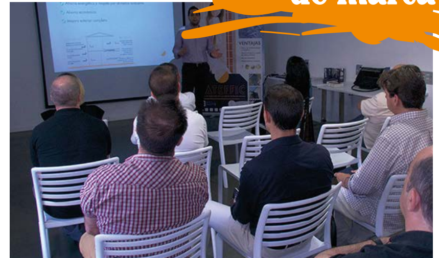
Blatem Aftework (charlas con expertos del sector)