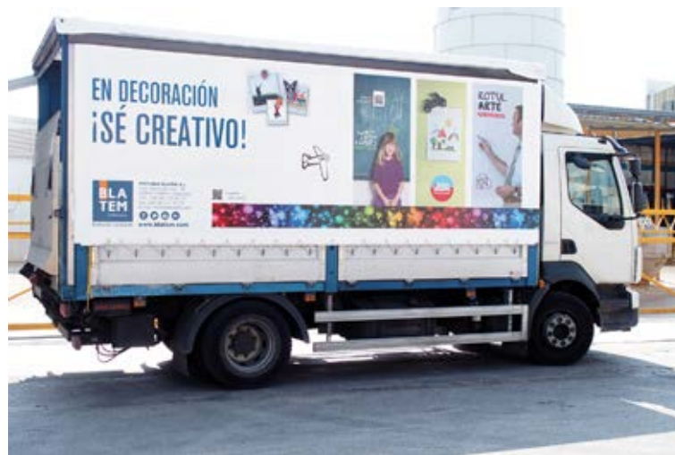
Flota de vehículos