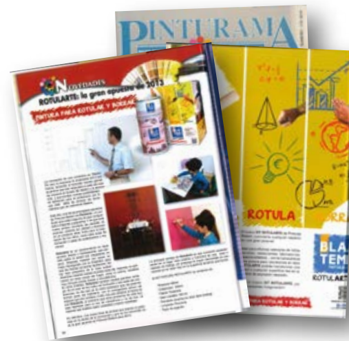
Publicidad en medios del sector