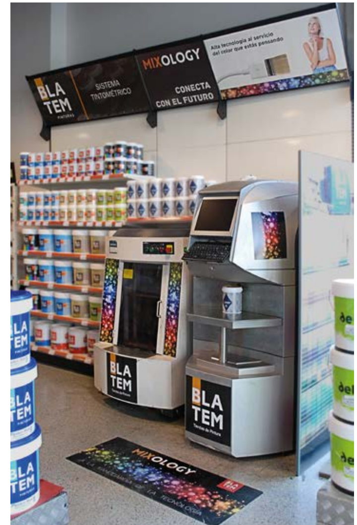
Imagen de marca