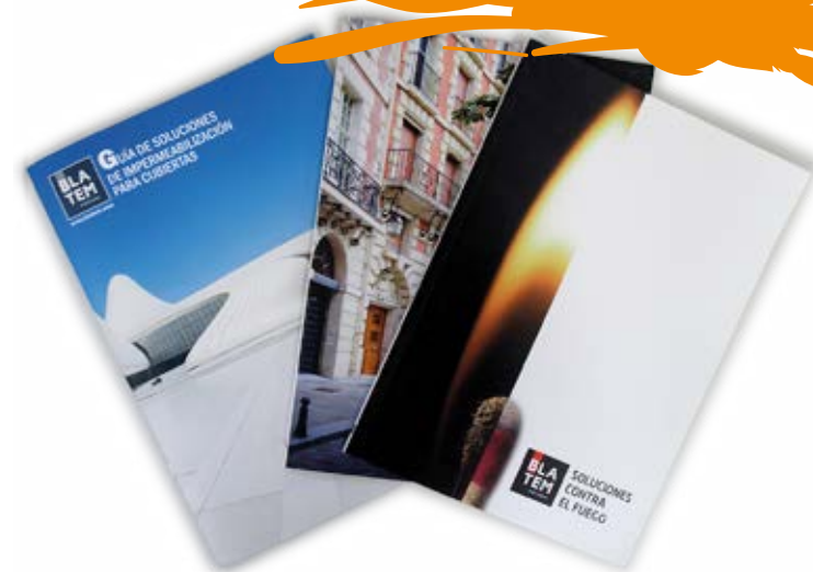
Dossiers de productos técnicos