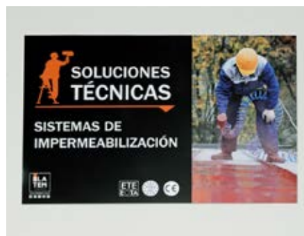
Cartelería de temporada